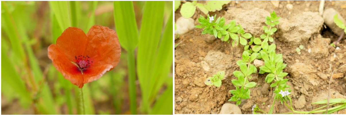
Abb. 8 & 9: Saat-Mohn und Ackerröte sind darüber hinaus Segetalarten, welche neben dem Bunten Hohlzahn und der Kleinen Wolfsmilch in Bayern auf der Vorwarnliste stehen (RL BY V)

Mit dieser Artenzusammensetzung gehört die Segetalflora in den Verband der Ackerfrauenmantel-Windhalm-Ackerwildkrautgesellschaften ( Aphanion arvensis J. Tüxen et Tx. in Malato-Beliz et al. 1960), welche auf sandigen bis lehmigen, nährstoffarmen, sauren Böden vorkommen. Das Vorkommen von 5 Arten, welche bereits auf den Vorwarnlisten Bayerns bzw. Deutschlands stehen, zeigt die Wertigkeit dieses mageren Ackerstandortes.