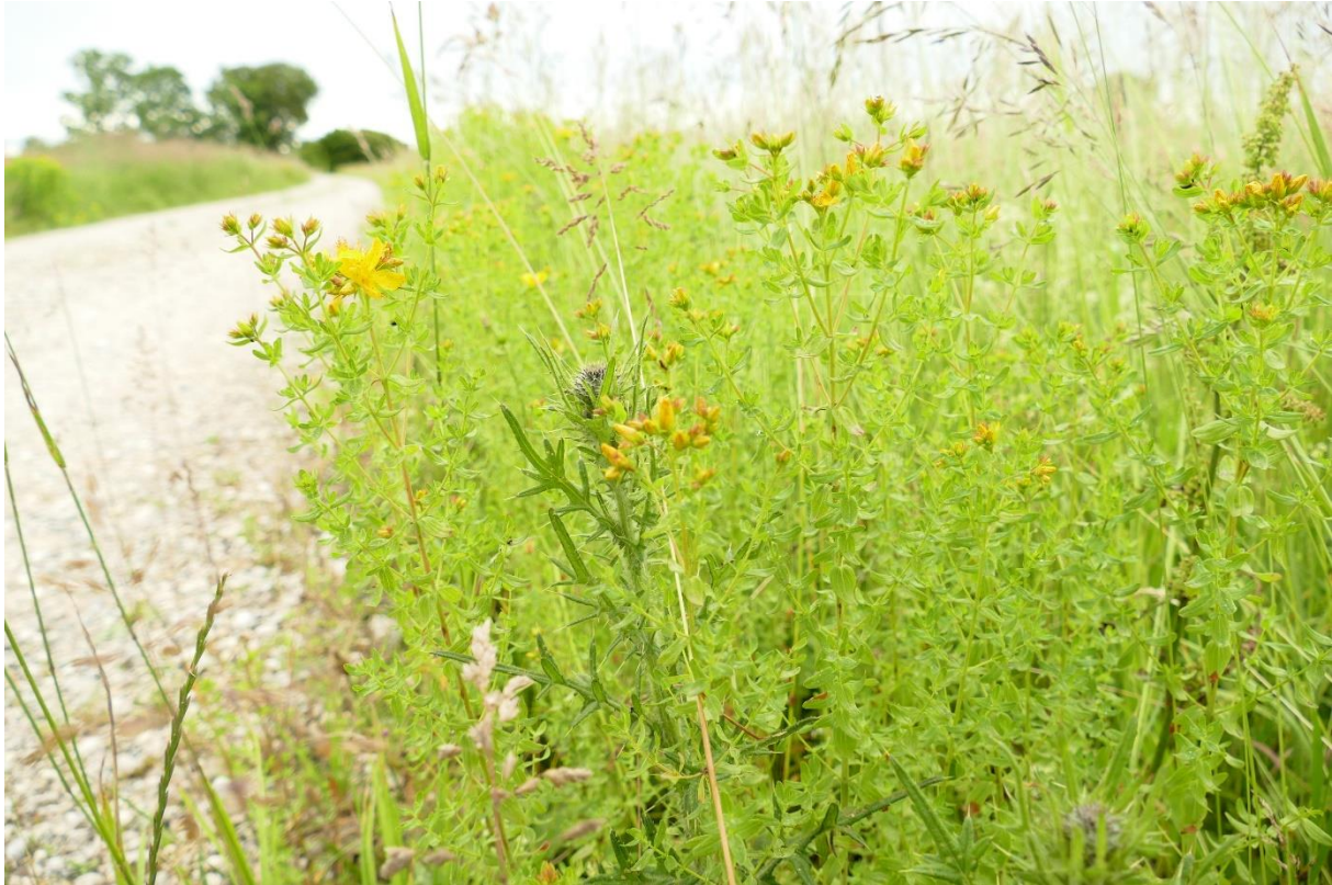
Abb. 10: Wegsaum mit Knaul-Gras, Wiesen-Rispengras, Tüpfel-Hartheu und Gewöhnlicher kratzdistel