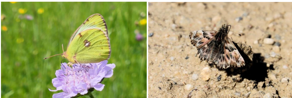
Abb. 17 und 18: Goldene Acht (links) und Malven-Dickkopffalter (rechts).