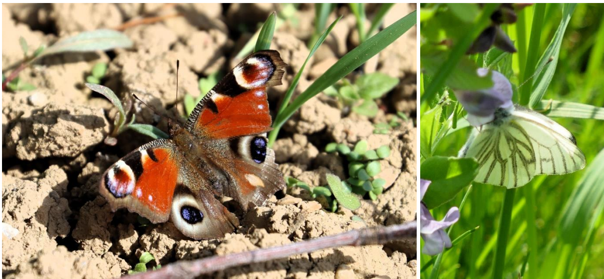
Abb. 15 und 16: Tagpfauenauge (links) und Grünader-Weißling (rechts).

Beispielhaft soll die Gruppe der Tagfalter genannt werden, so konnten im Gelände als Zufallsfunde Arten wie Tagpfauenauge Aglais io , Grünader-Weißling Picris napi , aber auch seltenere Arten wie Goldene Acht Colias hyale (RL BY G) und Malven-Dickkopffalter Carcharodus alceae angetroffen werden.