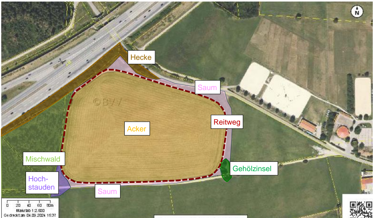
Abb. 3: Ausschnitt aus dem Luftbild mit Kataster mit Darstellung der angetroffenen Biotoptypen