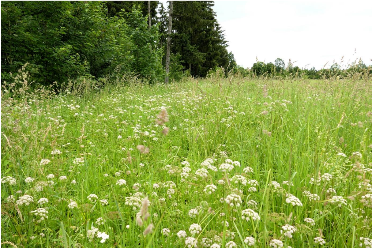
Abb. 11: Hochstaudenflur mit dominantem Giersch am estlichen Waldrand

Die kleine Gehölzgruppe auf der Südostecke bilden Gewöhnliche Esche Fraxinus excelsior , Vogel-Kirsche Prunus avium , Sal-Weide Salix caprea , Roter Hartriegel cornus sanguineum und Weißdorn Crataegus spec.