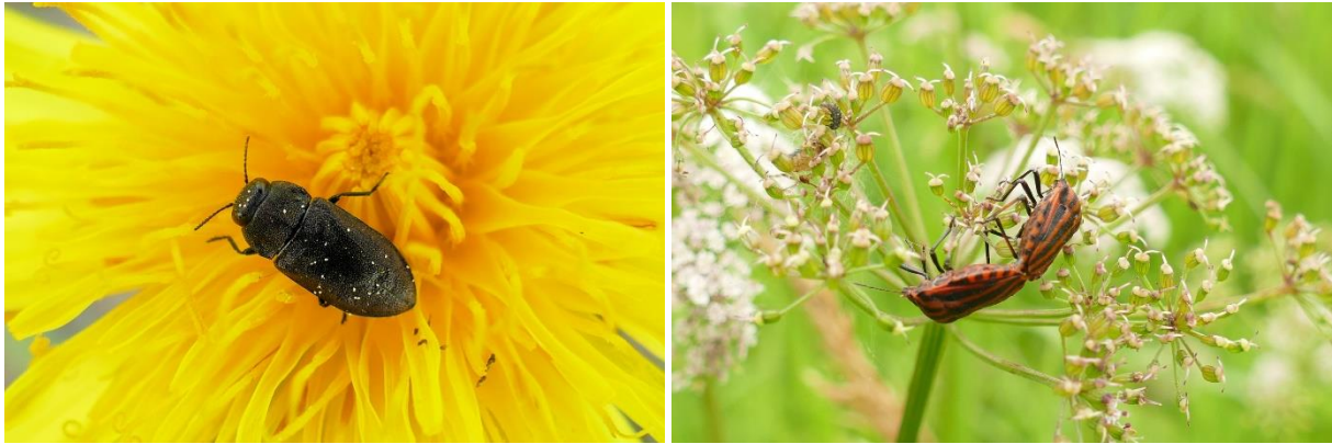
Abb. 19 und 20: Prachtkäfer (links) sind gesetzlich geschützt und Streifenwanzen auf einer Giersch-Dolde (rechts).

Aus der Gruppe der Wanzen wäre die Streifenwanze Graphosoma italicum zu nennen, welche wärmeliebend ist und am geschützten Waldrand auf Doldenblüten zu finden war.