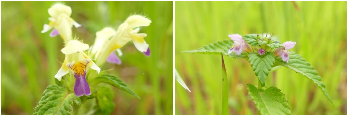
Abb. 4 - 7: Bunter Holzzahn (RL BY V), Stechender Holzzahn, Gezählter Feldsalat und Acker-Stiefmütterchen als typische Segetalarten des Ackers im Plangebiet

Die Plangebietsfläche innerhalb des Reitkreises wird vollständig von einem Acker eingenommen. Im Jahr 2022 wurde hier Futtererbse angebaut. In diesem Jahr fand sich auf der Ackerfläche Hafer. Der Ackerstandort ist sandig, mager und entsprechend artenreich an Ackerwildkräutern, was darauf hindeutet, dass der Acker extensiv bewirtschaftet wird. Die vorgefundene Ackerwildkrautarten waren: Persischer Ehrenpreis Veronica persica , Feld-Ehrenpreis Veronica arvensis , Gewöhnlicher Löwenzahn Taraxacum sect. ruderalia , Acker-Winde Convolvulus arvensis , Kriechendes Fingerkraut Potentilla reptans , Gewöhnlicher Rainkohl Lapsana communis , Gezählter Feldsalat Valerianella dentata (RLD V), Gewöhnlicher Saat-Mohn Papaver dubium ssp. dubium (RL BY V), Bunter Holzzahn Galeopsis speciosa (RL BY V), Stechender Holzzahn Galeopsis tetrahit , Rettich Raphanus sativus , Acker-Stiefmütterchen Viola arvensis , Gewöhnliches Ferkelkraut Hypochaeris radicata , Gewöhnlicher Frauenmantel Alchemilla vulgaris agg., Gänse-Fingerkraut Potentilla anserina , Windhalm Apera spica-venti , Weiche Treppe Bromus hordeaceus , Kleine Wolfsmilch Euphorbia exigua (RL BY V), Acker-Vergissmeinnicht Myosotis arvensis und Ackerröte Sherardia arvensis (RL BY V, RLD V).