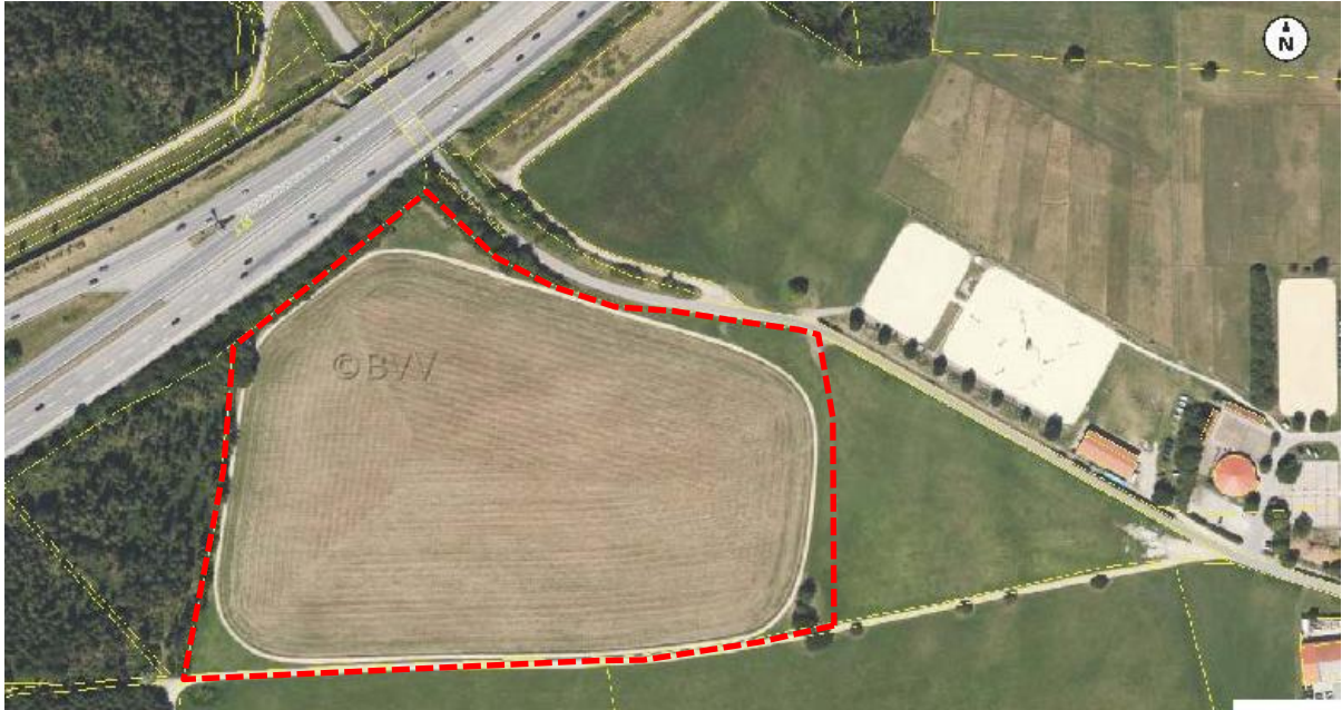
Abb. 2: Ausschnitt aus dem Luftbild mit Kataster mit Darstellung der ungefähren Lage des Plangebietes (rot gestrichelter Umring)

Aus der Abbildung 2 ist ersichtlich, dass es sich bei der Planfläche, welche mit Solarmodulen belegt werden soll, vollständig um Ackerland handelt. Um die Ackerfläche führt ein Reitrundweg mit einem Belag aus Holzspänen. Lediglich an den Rändern sind Säume, Hochstaudenfluren und Hecken ausgebildet.