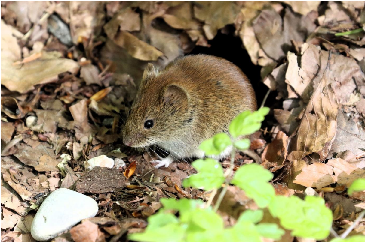
Abb. 14: Rötelmaus vor ihrem Bau am Heckenrand

Deckung für Kleinsäuger wie Igel oder Feldhasen bietet hier die Wald- und Gehölzränder. Mit jagenden Fledermäusen ist hier entlang der bewachsenen Wege, Hecken und Waldränder zu rechnen. Der Acker war reich an Mauselöchern und Gängen. Nachgewiesen wurden Feldmaus und Rötelmaus. Die Mäuse bieten für Greife und Eulen eine gute Nahrungsgrundlage.