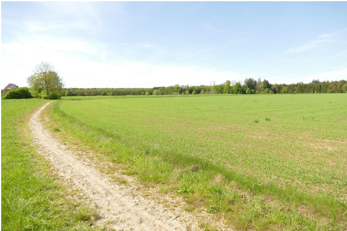
Ausschnitt Untersuchungsgebiet, Blick von Nordwest in Richtung Südost