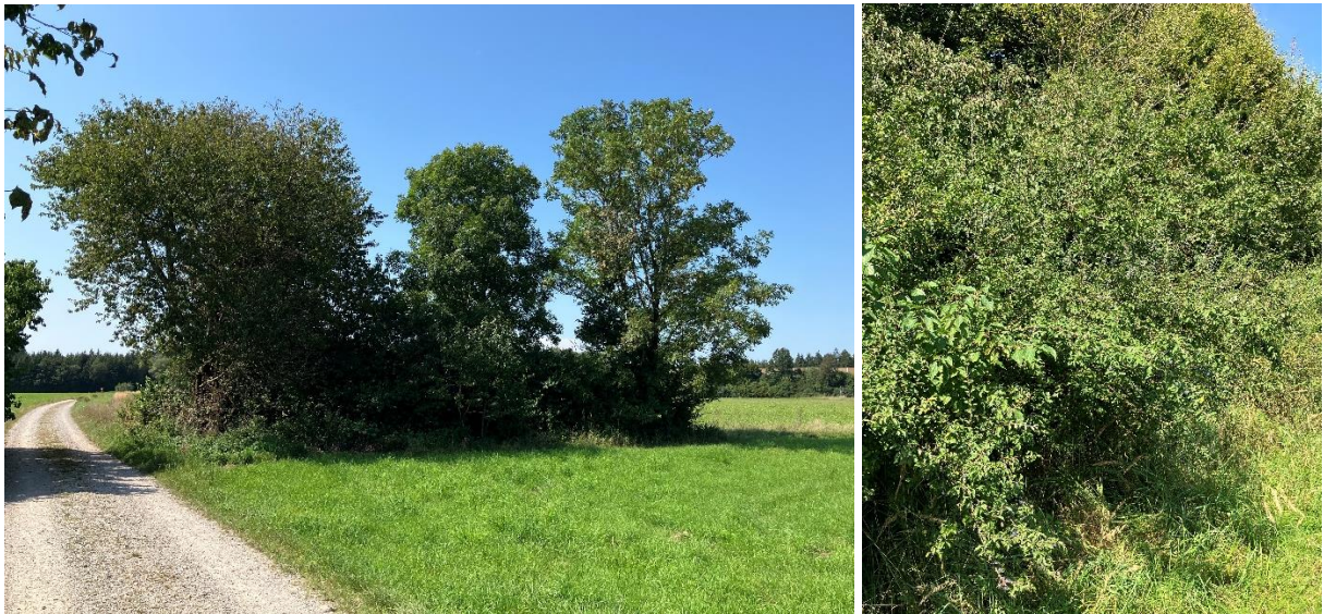
Abb. 12 & 13: Gehölzgruppe auf der Südostecke (links) und Hecke mit Schlehe und Hartriegel an der Taufkirchener Straße